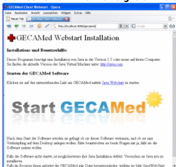
Abb. 3: Startbildschirm im Browser Zum Starten klicken sie einfach auf „Start GECAMed“.

Im folgenden Schritt werden weitere Installationsschritte und konfigurationen durchgeführt. Brechen Sie die Installation hier auf keinen Fall ab. Das System ist sonst in einem unsauberen Zustand und kann einen erneuten Installationsversuch verhindern. Der Installer wird versuchen einen Browser zu öffnen. Dieser versucht eine Seite zu laden, die im ersten Versuch nicht erreichbar ist. Der Grund dafür ist, dass sich im Hintergrund der Server im Startvorgang befindet. Warten Sie ein paar Minuten und drücken dann im Browser auf „Neu laden“. Sie sehen nun die Startseite von Ihrem erfolgreich installierten GECAMed Server.