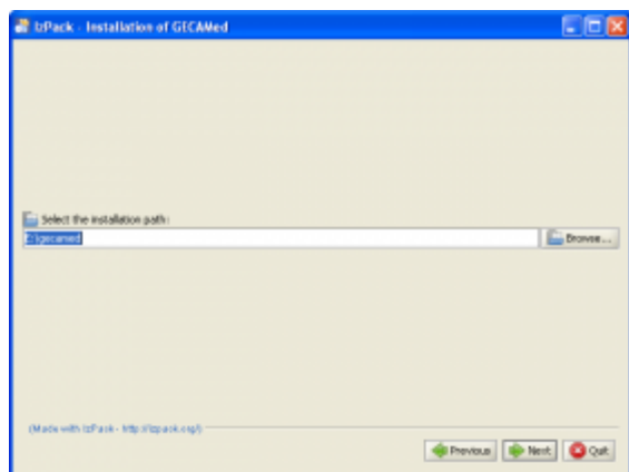
Abb. 1: Auswahl des Installationsverzeichnis

Entpacken Sie die Zip Datei und führen Sie die Datei setup.exe aus.