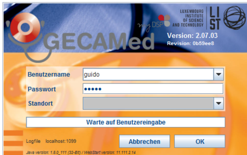
Abb. 2: Login Bildschirm

Bestätigen Sie die Eingabe der Zugangsdaten mit dem „OK“ Knopf und GECAMed startet.