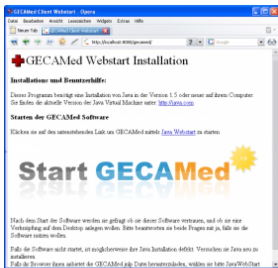
Fig. 3: Page affichée dans le navigateur

En fin d'installation, votre navigateur internet par défaut devrait charger une page à partir du serveur GECAMed fraîchement installé. Le serveur est lancé en arrière-plan à chaque démarrage de l'ordinateur. Si la page ne se charge pas, attendez quelques minutes et rafraîchissez la page (F5). Si vous apercevez maintenant la page, c'est que votre serveur GECAMed s'est installé avec succès.