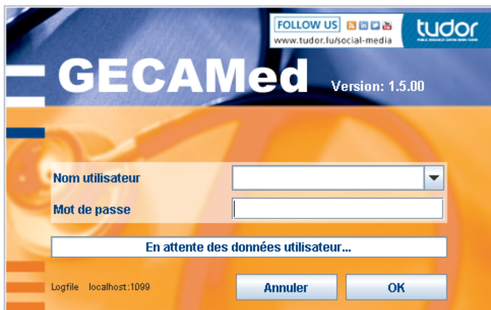
Fig. 2: Écran d'inscription

Confirmez votre identification en cliquant sur le bouton "OK". GECAMed démarre.